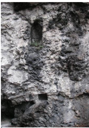
La nicchia più antica

Per altro a valle dell'attuale collocazione è presente un'altra nicchia, molto più piccola, sotto la quale si individua un foro che poteva ospitare una cassetta per le elemosine. Ci sono state quindi due realizzazioni successive? Una prima di dimensioni più modeste e successivamente quella attuale? O prima della devozione alla Madonna era praticato il culto di qualche altro santo?