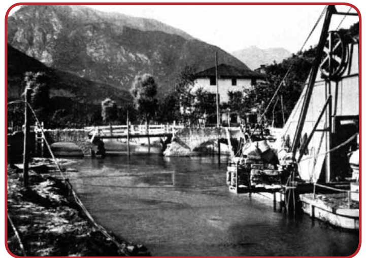
I lavori al ponte degli anni '30. La foto evidenzia il vecchio ponte a 3 archi in muratura, ricostruito nel 1886, dopo l'alluvione del 1882.

L'alluvione del 1882 aveva seriamente danneggiato anche il ponte sul Rimone e nonostante il diniego delle autorità provinciali nel riconoscere i sussidi per il rifacimento della struttura, le autorità comunali, vista l'urgenza e l'inderogabilità dell'intervento, decisero di effettuare le prestazioni sulla base di un preventivo di spesa di 1370 fiorini (anno 1886). In sede di esecuzione dei lavori, però, si cercarono di ridurre le opere previste. Comunque si allargò la larghezza del manufatto, portandola a 3 metri per una lunghezza di 24 metri, vennero rifatti i parapetti elevandoli a 90 cm. ed infine si raccordarono le strade alle due teste di ponte, utilizzando in parte il materiale di risulta dalle demolizioni e ricoprendolo poi con uno strato di legante. Il costo finale fu di 1.338,89 fiorini.