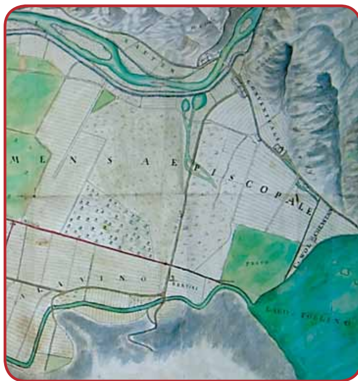
La mappa acquerellata di G. Franceschini (1779) con in primo piano la zona di Ponte Olivetti e maso Bertini (ora Graziadei)

et eredi e suoi successori sijno obligati e tenuti sempre nelli tempi in avvenire in infinito detto Ponte nel medemo mantener e se cascasse nuovamente nel primo essere fabricare....; però se ... l'acqua della Sarca venisse a detto Ponte e facesse cader e diroccar quello, che all'hora li huomini prenominati delle ville sijno tenuti far l'istesso ponte a sue spese”.