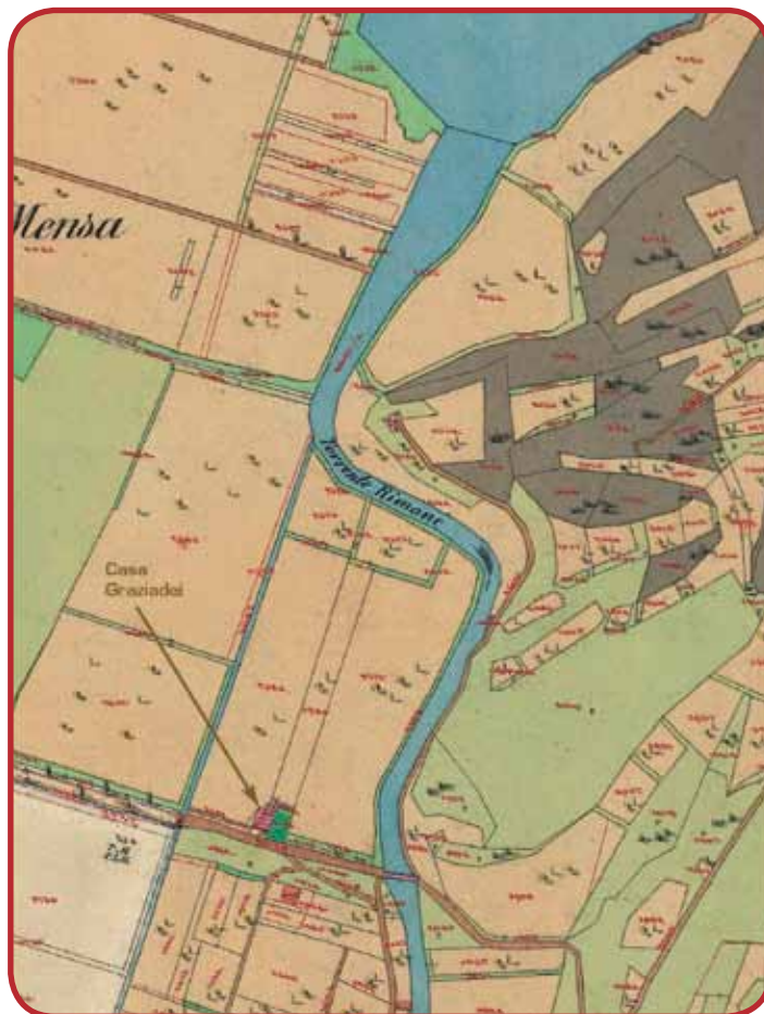
La mappa del catasto austriaco (1859) con la zona di Ponte Oliveti.

Tornando indietro nel tempo, vediamo che il centro rurale di Ponte Oliveti si originò – al pari degli altri centri del Piano Sarca- attraverso la colonizzazione a maso, a partire dal maso Bertini (ora Graziadei). L'impronta edificatoria si è mantenuta costante nel tempo con grandi volumi in stretta relazione