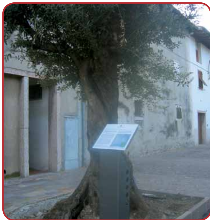
L'ulivo secolare con la tabella storica

D'altro canto l'unico spazio, che potesse consentire questo tipo d'intervento era la rinominata piazza dell'Agricoltura al centro dell'agglomerato, su cui si affacciano la gran parte degli edifici. Il primo riferimento da consolidare nella memoria non poteva che essere un forte richiamo al toponimo della località e la scelta non poteva che cadere su una secolare pianta d'ulivo, che evidenziasse soprattutto nel tronco la lunga storia del luogo, sintetizzata sulla tabella, illustrata