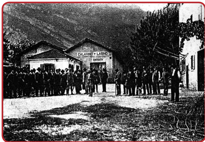
Sullo sfondo l'edificio della Cooperativa per lo smercio dei prodotti viticoli di Calavino e Lasino con i soci in primo piano in una foto del tempo.

Nel 1909 sulla spinta del movimento cooperativistico trentino muoveva i primi passi la "Cooperativa per lo smercio dei prodotti viticoli Calavino – Lasino"; una società fondata allo scopo "di far conoscere ed accreditare i prodotti vinicoli dei propri soci e di favorirne lo smercio, tanto all'interno quanto all'esterno" 5 . Vi facevano parte circa 120 soci dei 2 Comuni e possedeva un edificio, a Ponte Oliveti, per lo svolgimento dell'attività societaria. Pur disponendo di una buona attrezzatura per la lavorazione dei mosti, come è precisato in qualche verbale di revisione, pare non abbia mai "lavorato ad uso cantina sociale"; anzi l'immobile era concesso in affitto a qualche grossista vinicolo della valle.