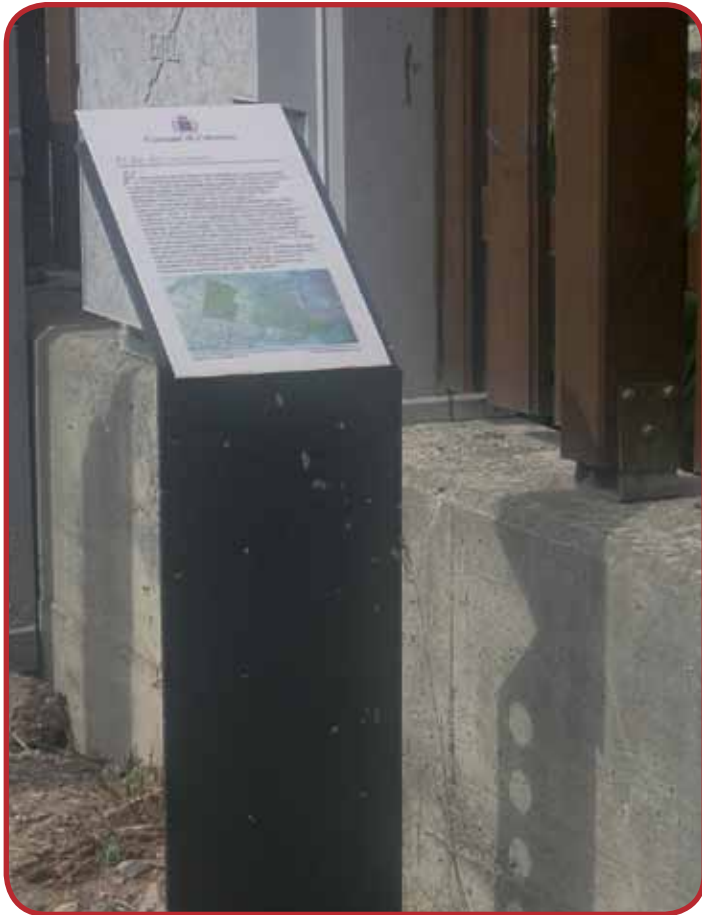
La targa posta nel febbraio 2010 dal Comune per indicare il toponimo "el fòs dei migranti".

Al di là dell'insediamento industriale, ai piedi della collina di Frassenè con l'occupazione, oltre al versante collinare per la cava, della parte nord della località "Sachét", il rimanente paesaggio rurale – pur caratterizzato dall'evoluzione della tecnologia agricola, basata ora esclusivamente su frutteto e vigneto- è rimasto sostanzialmente uguale. Ricordiamo che rimasero inalterati i confini amministrativi fra i Comuni di Calavino e Lasino, concordati con la rottura del Patto d'Unione nel 1767 (dopo 339 anni di gestione associata); in particolare da citare el fòs dei migranti, che segnava il confine fra i 2 territori comunali, chiamato così per indicare il flusso migratorio stagionale dei giovani di Calavino, che nella seconda metà dell'800 si recavano nel periodo, compreso fra il tardo autunno e l'inizio della primavera, nelle vicine terre lombarde e venete per svolgere dei lavori agricoli.