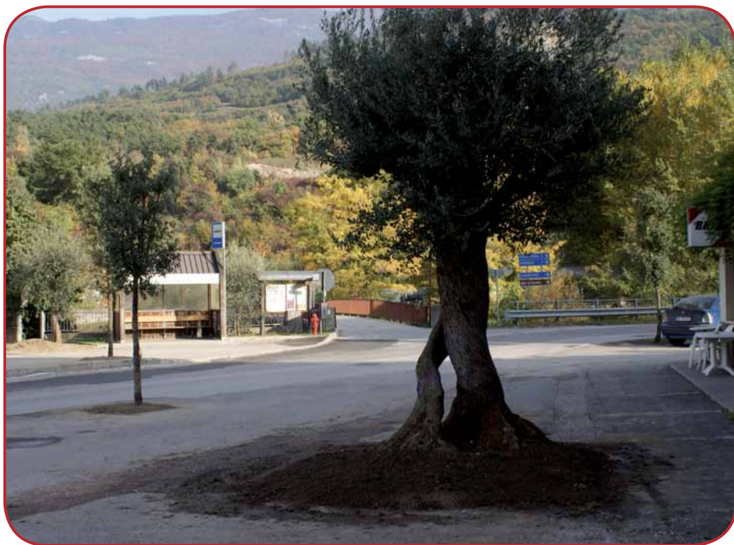
Sullo sfondo s'intravede l'intervento di piantumazione del lembo di piazza oltre la strada con un'altra pianta d'ulivo ed alcuni lecci.