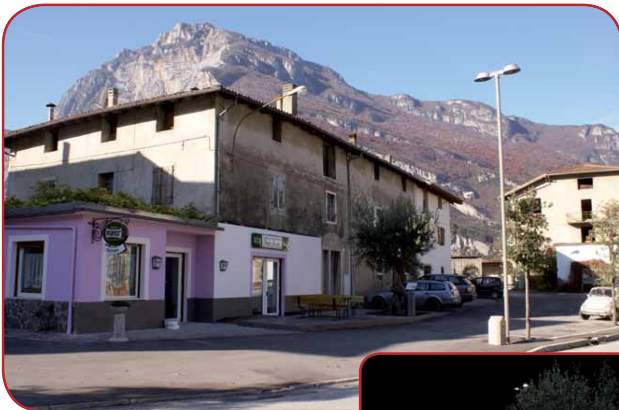
Una panoramica dell'intervento di arredo della piazza, a cui si è abbinata la ristrutturazione della "trattoria"; in particolare i dissuasori in pietra rossa e la nuova illuminazione pubblica a "led".