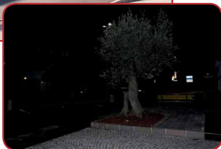
Foto notturna di Ponte Oliveti con la nuova illuminazione a "led"

dalla mappa acquerellata di G. Franceschini del 1779 e dalla trascrizione dell'estratto documentario del 1556 (si veda la parte iniziale dell'articolo), riguardante la prima costruzione in pietra del ponte.