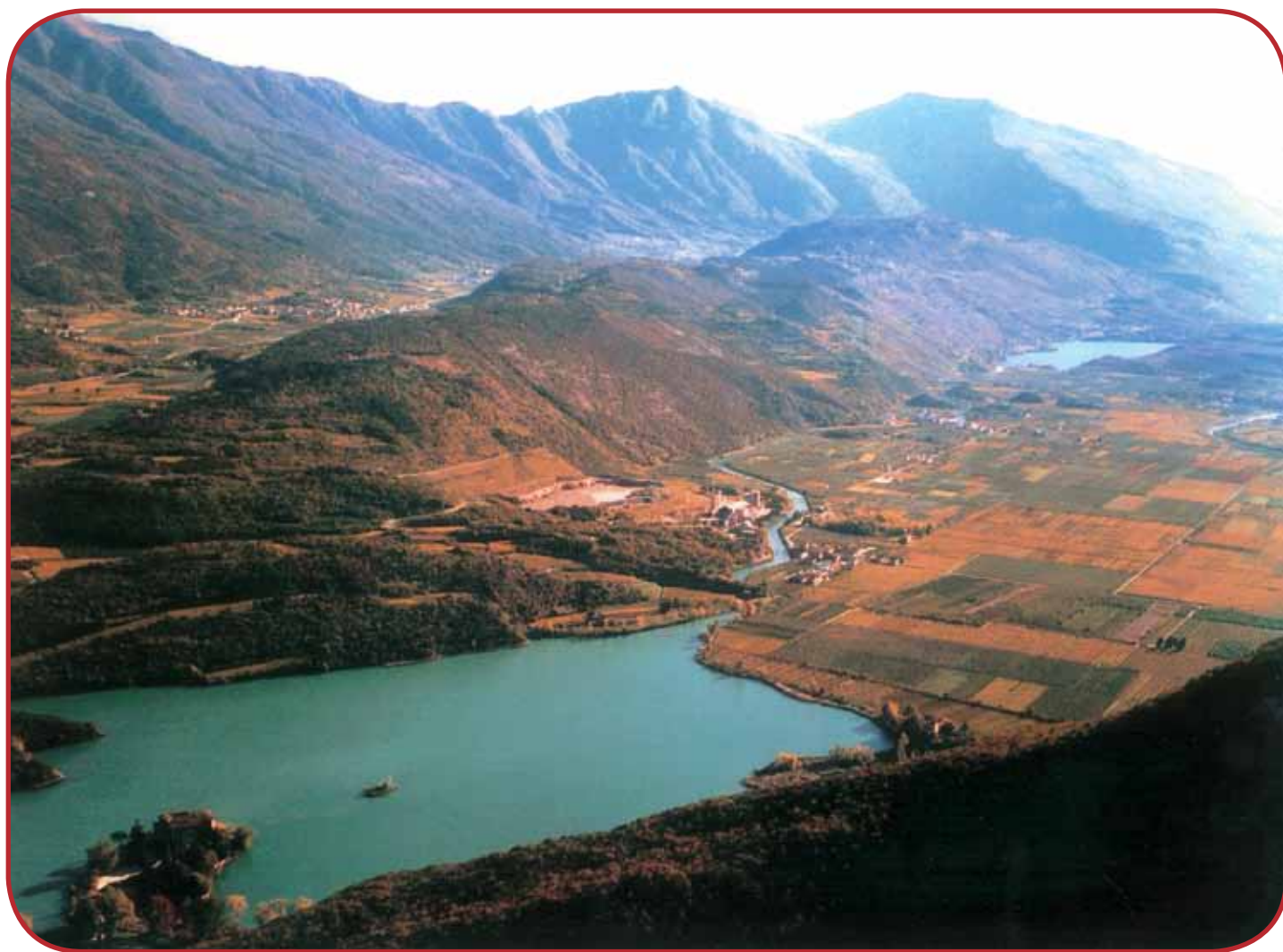
Il rendering evidenzia la situazione paesaggistico - ambientale della cava del cementificio fra una decina d'anni